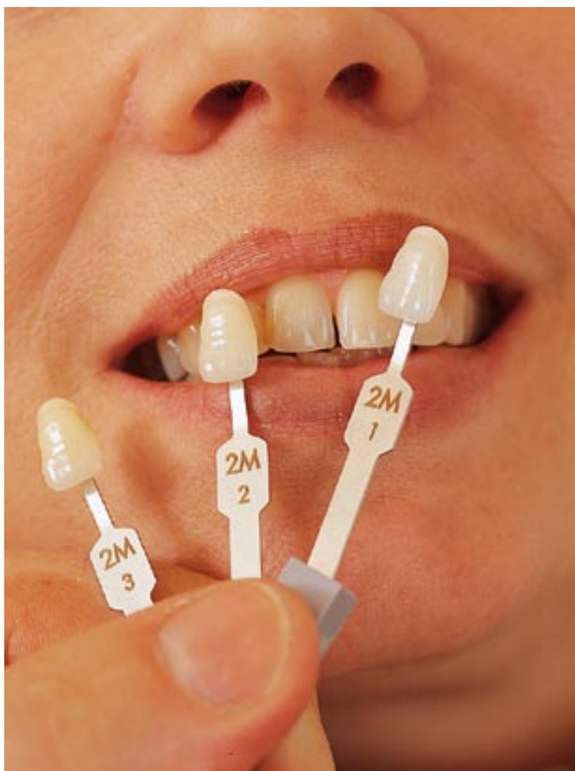
Farveudtagning ved 3D-master farveskala

- Farverne er vigtige, hvis der skal udføres et perfekt stykke arbejde. Det er relativt svært at tage en farveprøve, men man kan godt forlange, at tandlægerne lærer det. Det vil højne standarden, og omlavninger vil undgås!